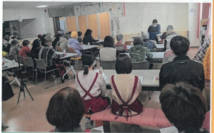
第3回「あなたも狙われている！？特殊詐欺」 会場の様子