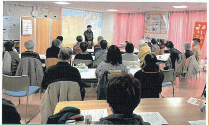
第1回「がけっぶち！？日本の台所事情」の様子