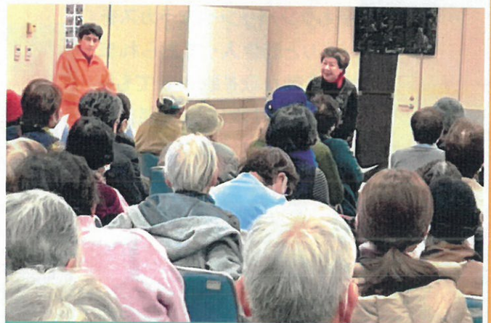
第4回 映画上映 「老後の資金がありません」 サロンシネマ様の挨拶