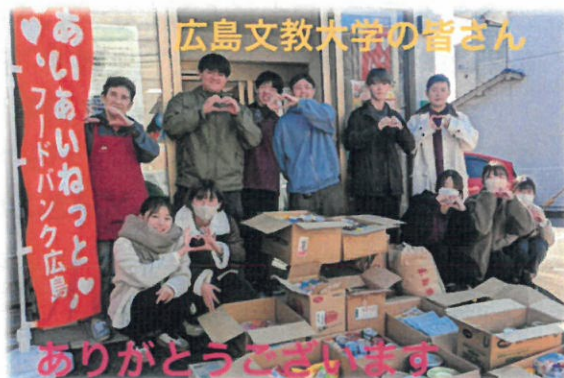
ありがとうございます

フードドライブ本番までに、事前に食品ロスやフードバンクなどについて学習し、計画、実施されており、勉学に忙しい中、とても大変だったろうと思います。食品を提供してくださり、とてもありがたく、嬉しく思います。いただいた食品は、大事に活用させていただきます。どうぞ、来年度も、よろしくお願ひします。