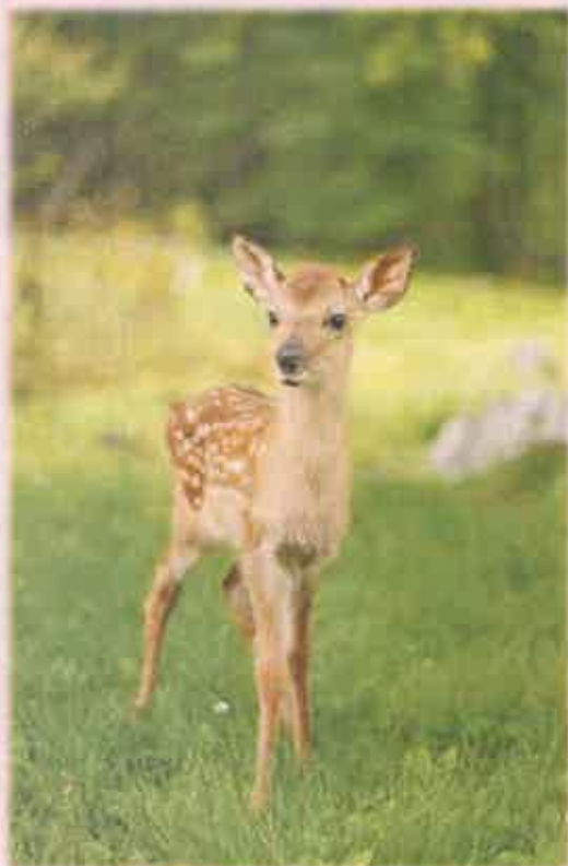
【写真はイメージです】

皆さんこんにちは。寒かった気候も徐々に落ち着き、天気の良い日には春の香りが鼻をくすぐるような気がする今日この頃、(私だけ?)いかがお過ごしでしょうか。